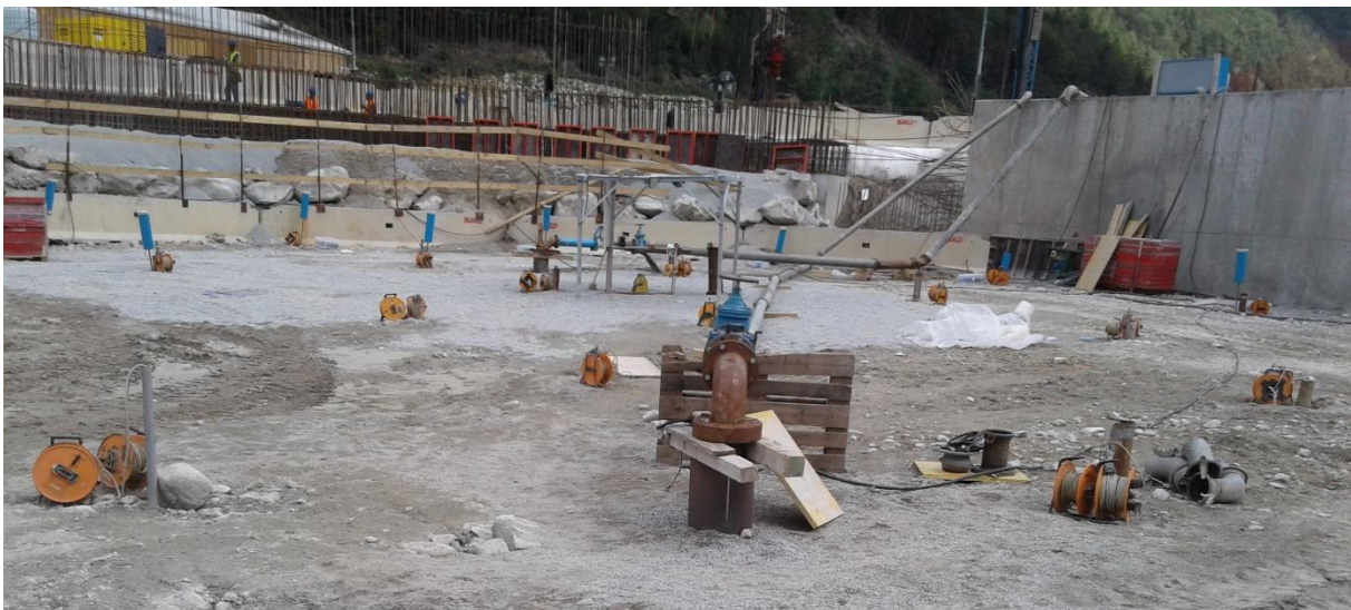
Temperaturmessketten am Brennerbasistunnel

Für Bauarbeiten, die unterhalb des Grundwasserspiegels stattfinden, sind abgedichtete Baugruben notwendig. Dafür ist es meistens notwendig die Grube hydraulisch von ihrer Umgebung abzutrennen. Daher wird die Baugrube künstlich abgedichtet. Mit Hilfe des Düsenstrahlverfahrens werden Dichtungselemente vertikal und wenn nötig horizontal hergestellt. Einströmendes Grundwasser in die Baugrube während des Entwässerns zeigt sich in der Änderung des Temperaturprofils in der Umgebung des betroffenen Bereiches. So ermöglichen die Temperaturmessungen, Lecks im Dichtungssystem zu orten.