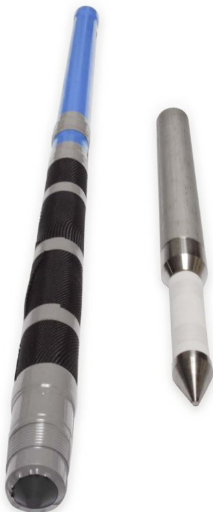
HPVC (links) und Einpress-Filterspitze (rechts)