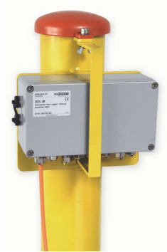
Piezopress Schutzrohr mit SDL-Data Logger